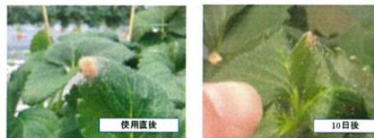
苺 500倍希釈液を葉面散布