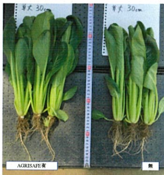
小松菜、1600倍希釈液を灌水で 1.2～1.5倍の生育