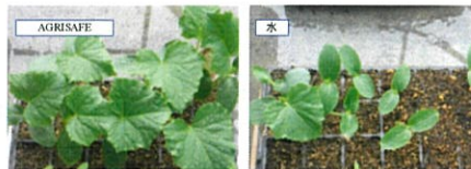
キュウリ 育苗17日目、2500倍希釈液