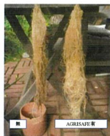
ミニトマト、水耕栽培 根の状況